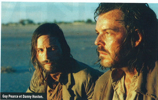
Guy Pearce et Danny Huston.